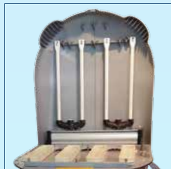
SILOTOP® zero 14 m²